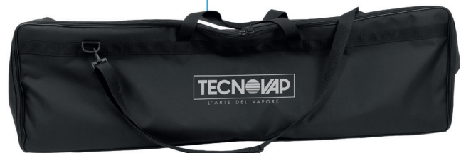
Borsa porta-accessori T.e.s.s.

* Possibilità di utilizzare vari accessori Star oppure, con un adattatore specifico, accessori Radames