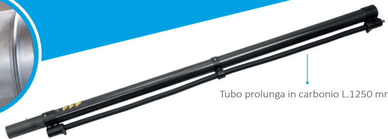
Tubo prolunga in carbonio L.1250 mm