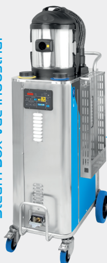
Steam Box Vac Industrial

La pulizia in altezza è solo una tra le tante applicazioni che i generatori di vapore Tecnovap possono offrire. Grazie ad una vasta gamma di macchine e accessori, Tecnovap mette a disposizione strumenti multifunzionali di pulizia, che permettono di risparmiare sul consumo di acqua, detergente e ridurre i tempi di pulizia in confronto a sistemi tradizionali.