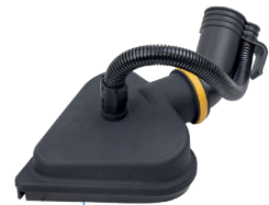
Spazzola triangolare vapore/aspirazione

* Possibilità di utilizzare vari accessori Star oppure, con un adattatore specifico, accessori Radames