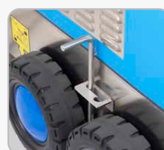
Freno di stazionamento