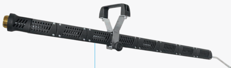
Lancia Geyser 1200mm con maniglia