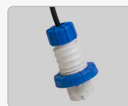
Presca elettrica 16A con cavo da 8metri