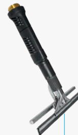
Tergivetro con diffusore 250mm - 350mm - 450mm