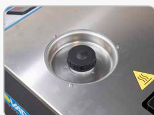
Contenitore sale per addolcire a bordo