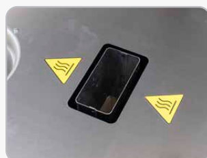
Scarico fumi caldaia