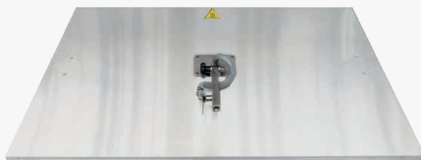
Piastra vapore L. 400x400mm - L. 400x800mm - L. 1200x1100mm