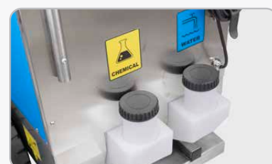
Serbatoio acqua da 35 litri e serbatoio detergente da 15 litri