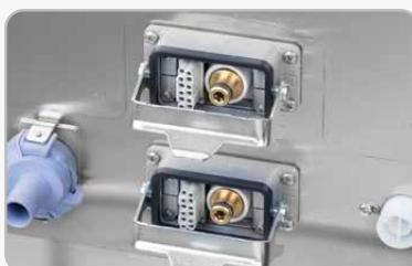
Doppia uscita vapore 10bar - 12P per l'utilizzo simultaneo con 2 operatori