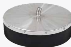
Convogliatore vapore rotondo