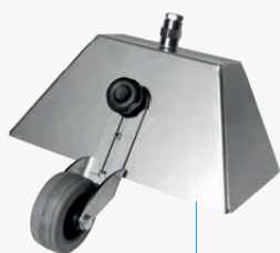
Convogliatore vapore rettangolare