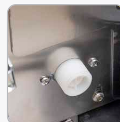
Connessione alla rete idrica