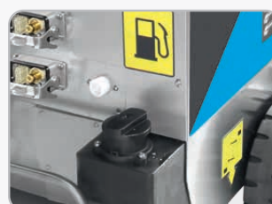
Serbatoio gasolio da 18 litri