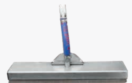
Spazzola vapore con setole 250mm - 350mm - 450mm