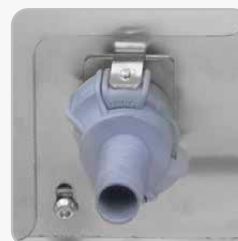
Scarico rigenerazione resine