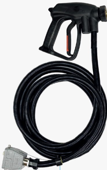
Impugnatura vapore 5m - 8m - 10m - 15m