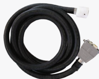
Tubo in silicone alimentare 4m - 8m - 10m