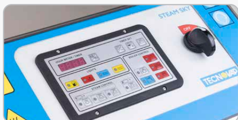
Pannello di controllo e switch ON/OFF